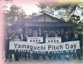
松下村塾での最終成果発表会（R4年度）