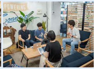
ガイアックスの過去のイベント

日時：2023. 8.5 (土) 第1部 14:00～17:00 第2部 18:30～アイデア出るまで