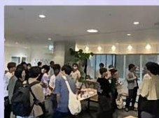
プレイベント後の交流会の様子