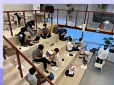
ガイアックスの「起業ゼミ」の様子